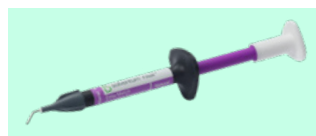
Solventum™ Filtek™ Easy Match Flowable Restorative 6225B, 6225N, 6225W