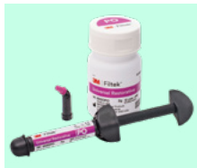
3M™ Filtek™ Universal Restorative 6550 + teinte 6555 + teinte