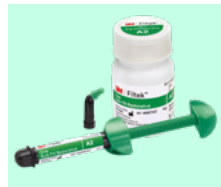
3M™ Filtek™ One Bulk Fill Restorative 4866 + teinte 4867 + teinte