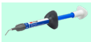
3M™ Filtek™ Supreme Flowable Restorative 6032 + teinte