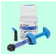
3M™ Filtek™ Supreme XTE Universel Restorative 4910 + teinte 4911 + teinte

Pour l'achat de 12 composites Filtek™ au choix: