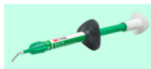
3M™ Filtek™ Bulk Fill Flowable Restorative 4861 + teinte